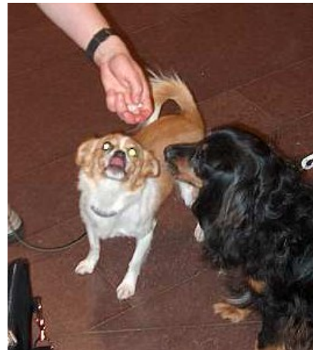
Stina och Irina