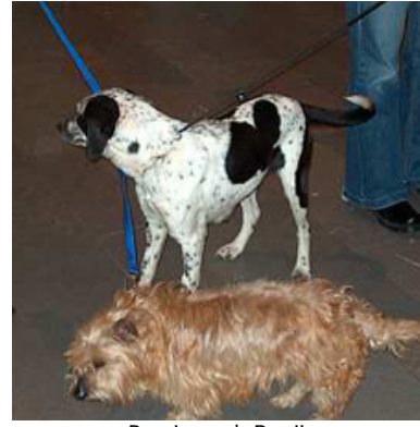
Romina och Benji