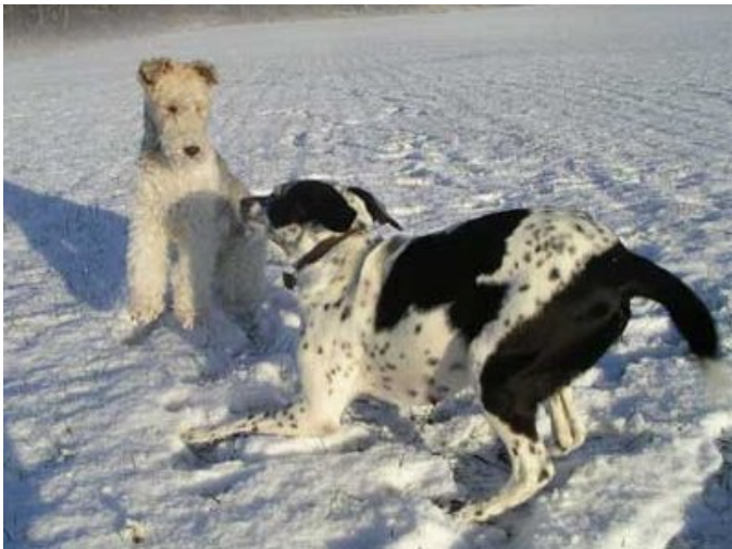
Pippi och Romina