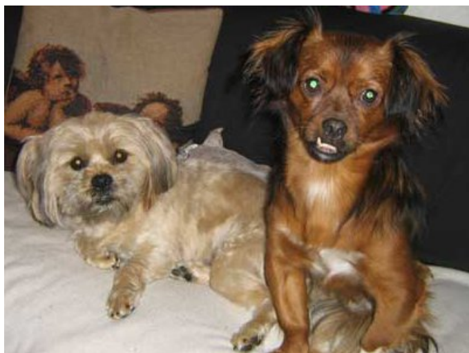
Daisy och Pascal