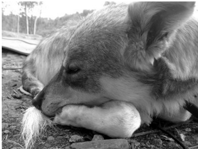
Fellow och Tazza