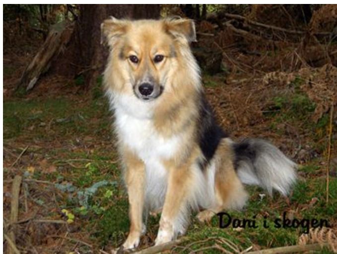
Dani i skogen