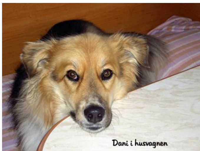
Dani i husvagnen