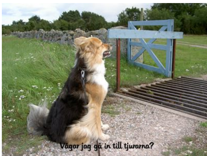
Väger jag gå in till tjurarna?