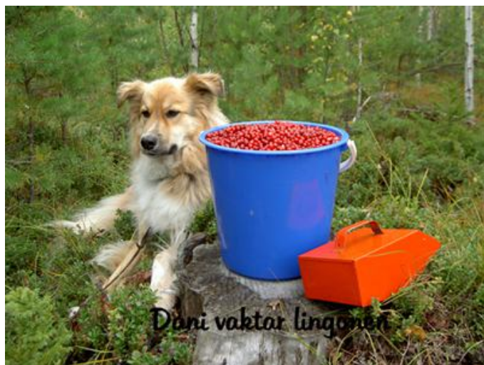
Dani vaktar lingonen